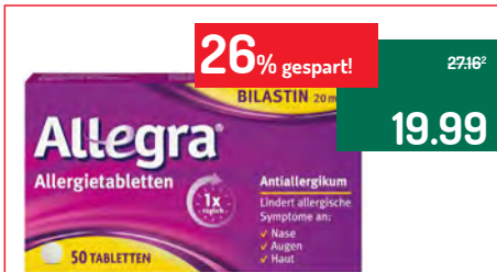
Allegra Allergietabletten® 50 Tabletten

P.S.: Auf Wunsch legen wir sehr gerne für Sie unsere Vorteilskarte an! Dann können Sie sofort alle Stammkundenvorteile nutzen.