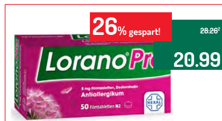
Lorano Pro Antiallergikum®* 50 Filmtabletten

Anwendungsgebiet: Zur Behandlung der Beschwerden bei allergischen Entzündungen im Inneren der Nase, z. B. Heuschnupfen, und bei chronischer Nesselsucht unbekannter Ursache. Wirkstoff: Loratadin