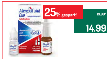
Allergodil akut Duo®

Anwendungsgebiet: Zur Linderung der Beschwerden allergischer Rhinokonjunktivitis und Urtikaria. Der Wirkstoff Bilastin ist ein Antihistaminikum der jüngsten Generation – wirksam bei Allergiesymptomen wie Niesen, tränenden Augen sowie Juckreiz, Rötung oder Quaddelbildung der Haut. Wirkstoff: Bilastin