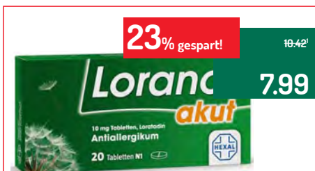
Lorano akut Antiallergikum®* 20 Tabletten

Zur symptomatischen Behandlung von saisonaler allergischer Rhinokonjunktivitis (z.B. Heuschnupfen in Kombination mit allergischer Bindehautentzündung) bei Erwachsenen, Jugendlichen und Kindern ab 6 Jahren. Wirkstoff: Azelastinhydrochlorid